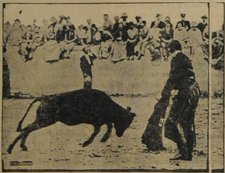
Unos cuantos pasos a emitación "Gaona" que fueron tomados en una reciente exhibición filmica. Los trajes de luces hacen a uno sentirse tal y como si estuviera muy cerca de México.

Mientras trabajaba en su laboratorio un químico, despararró una clara muestra sin ácido en su mano y descubrió que suavizó las callosidades, sin causar quemadura o lastimar la piel. Luego hizo experimentos sobre callos con tan buenos resultados, que hoy se pone en el mercado, bajo el nombre de "CORN OFF". Se advierte a los compradores que pidan este remedio "sin ácido". De venta por la farmacia Retail de Santa Paula.