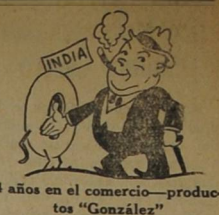
4 años en el comercio—productos "González"

Todo tiene su fin. Abandoné al cabo la seductora meseta