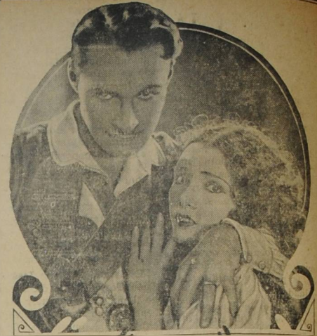
ROD LA ROCQUE AND LUPE VELEZ IN STAND AND DELIVER, PATHE