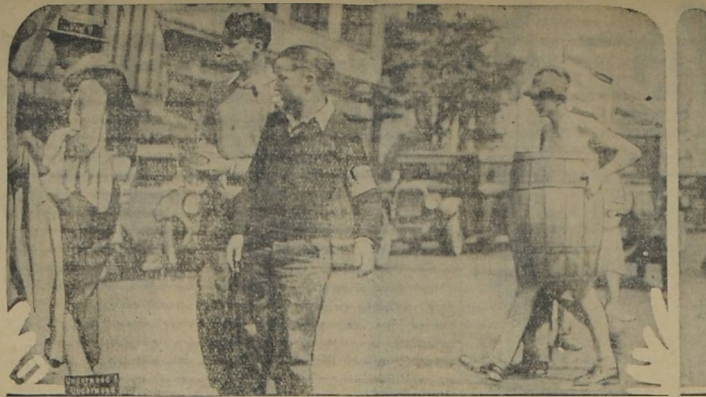
An unfortunate freshman of the University of California doing the "barrel walk" to the extreme amusement of the "upper-termers." He is working practically nothing besides the barrel, but takes it good naturedly as it's the "fall rush" of "freshies"—and all first termers must suffer.