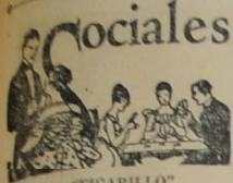
Por "FIGARILLO" Santa Paula, Cal.